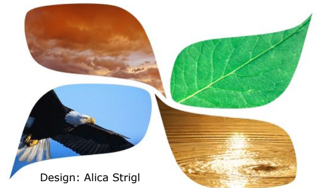
Design: Alica Strigl

es ELISABETHSACHERS Empathie und klare Worte